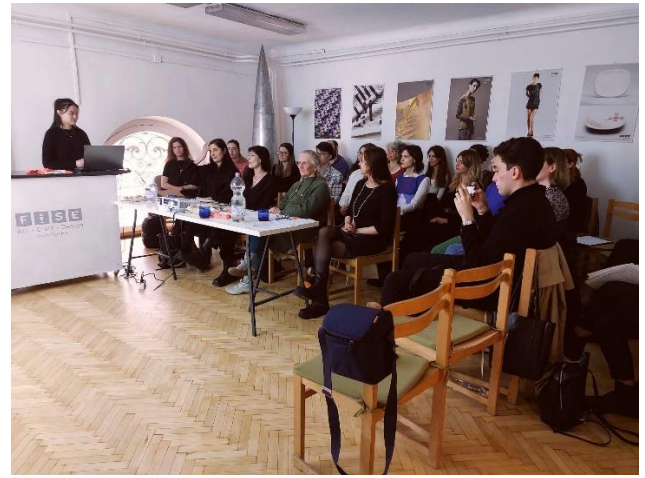
36. OMDK - Országos Tudományos Diákköri Konferencia Művészet- és Művészetelméleti Szekció kiállítása Április 11. - április 16.