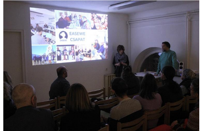
EASEWE / Erasmus+ Projektismertető FISE Est, 2023.02.15.