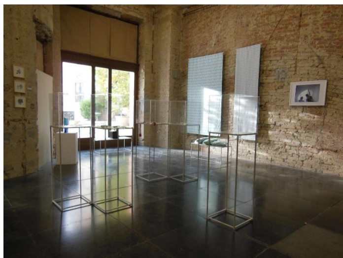
„Merítés” – A FISE Kortárs Gyűjtemény kiállítása. 2023. 10. 25. - 11.17. Nádor Galéria, Pécs