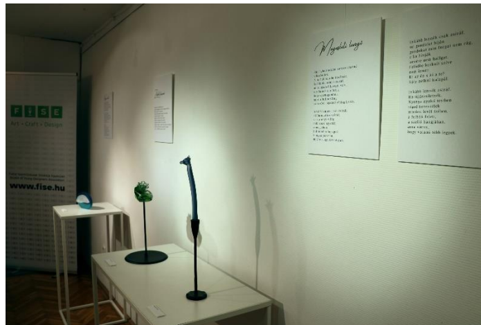
Modellált poéma - Kertész Krisztina üvegművész kiállítása November 14. - november 24.