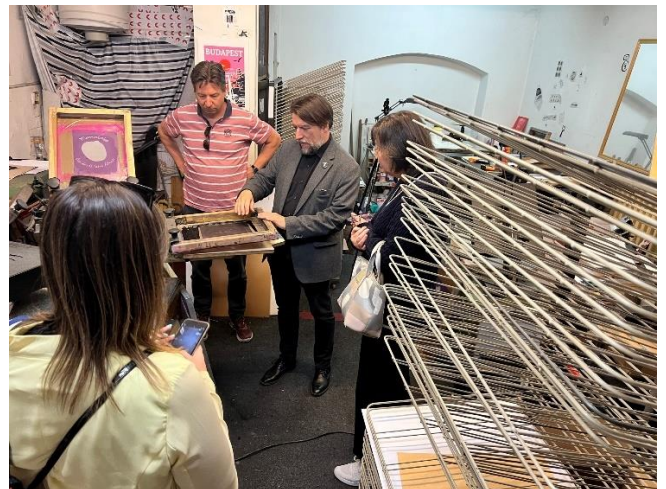
Betekintés a kortárs iparművészek mindennapjaiba FISE Est - Műtárgyak Éjszakája Fesztivál - 2023.05.19.