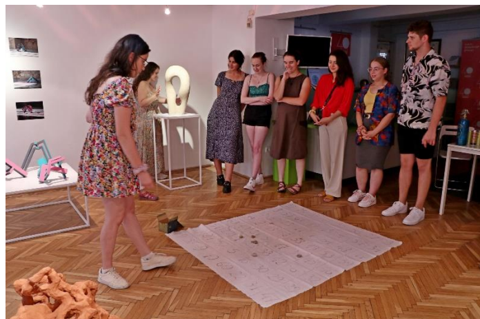
„START” PTE, Művészeti Kar, Formatervezés tanszék tárgyalkotás és kerámiatervezés kiállítása Augusztus 22. - szeptember 8.