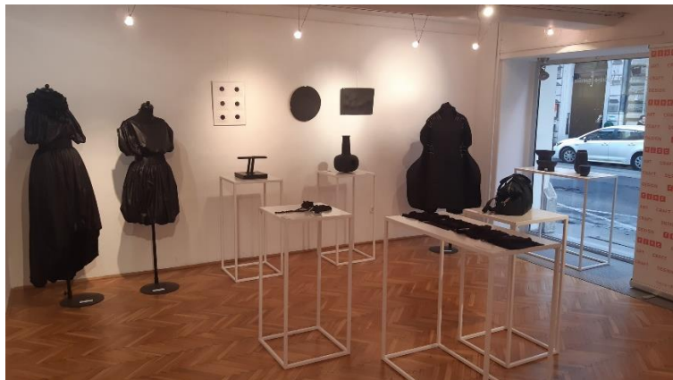
FEKÉTÉN-FEHÉR FEHÉREN-FEKETE a FISE tervezőinek kiállítása a 20. Budapest Design Hét keretén belül Október 10 - október 20.