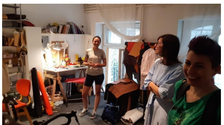
BETŰvetés előadás és beszélgetés FISE Est - 2023. 07. 19. // Belvárosi FISE Est - 2023. 09.23.