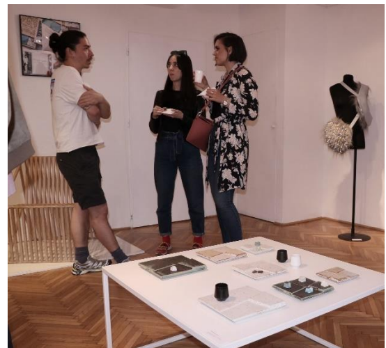
Fresh FIShEs XV. - a FISE 2022-ben felvett friss tagjainak bemutatkozó kiállítása Május 8 – május 26.