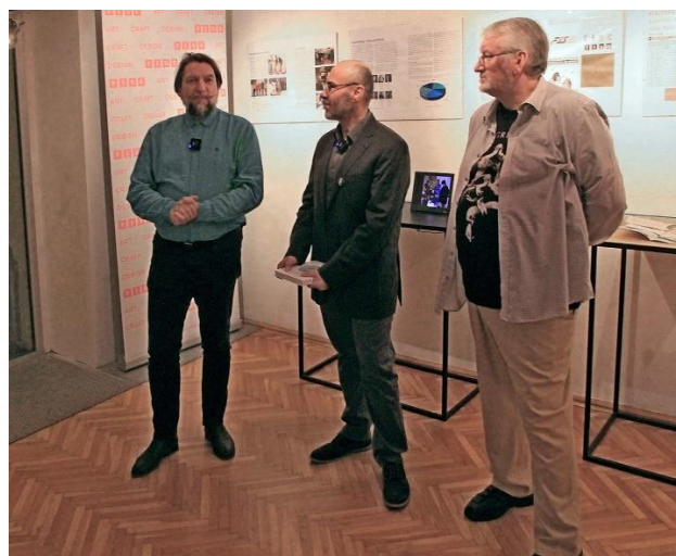
„Design, mint hal a vízben” (könyvbemutató kiállítás) - Február 14. - február 24.